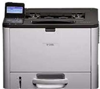
型番: RICOH SP 2300L